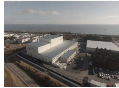
大熊町の仮設焼却施設