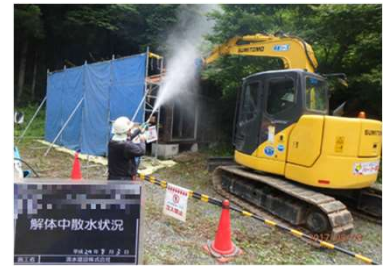
被災家屋等の解体の様子