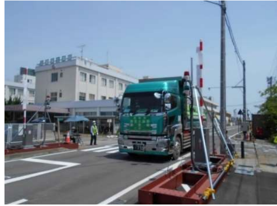
中間貯蔵施設からゲートを通して退域する輸送車両