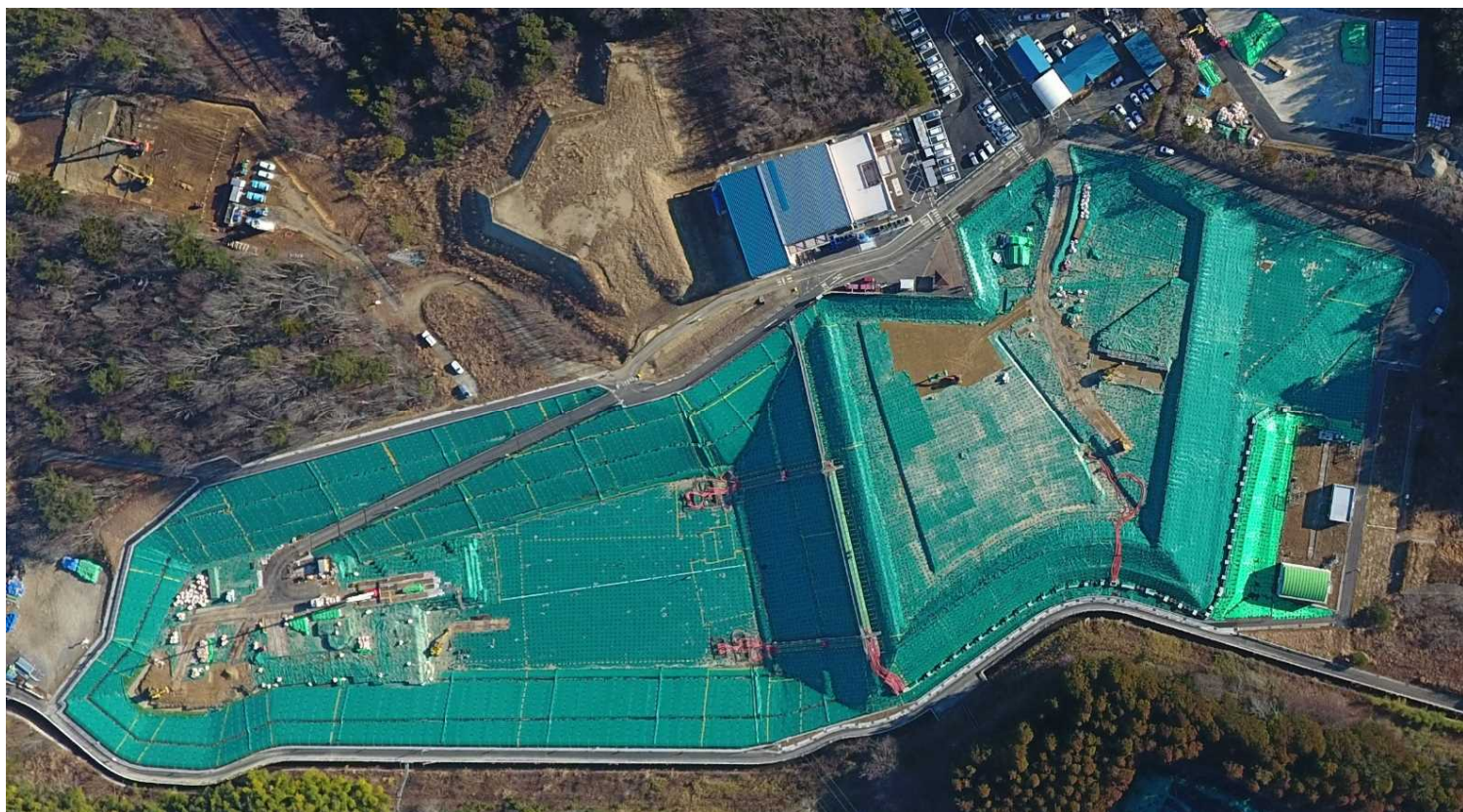
クリーンセンターふたば（2024年1月30日撮影）