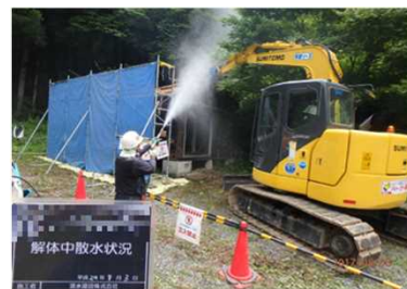
被災家屋等の解体の様子