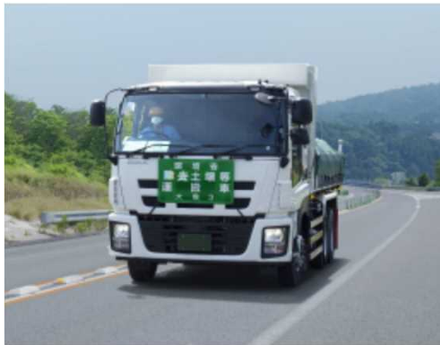
輸送車両の走行状況