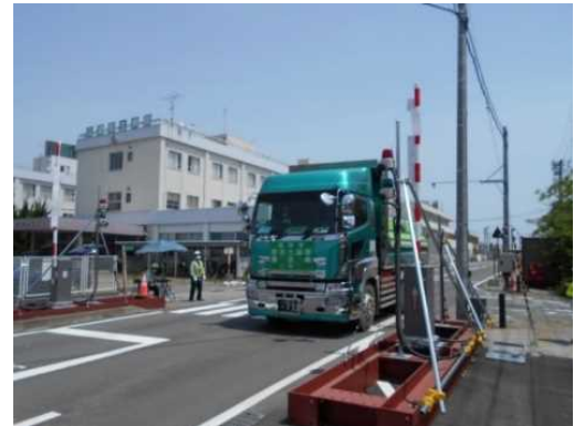
中間貯蔵施設からゲートを通して退却する輸送車両