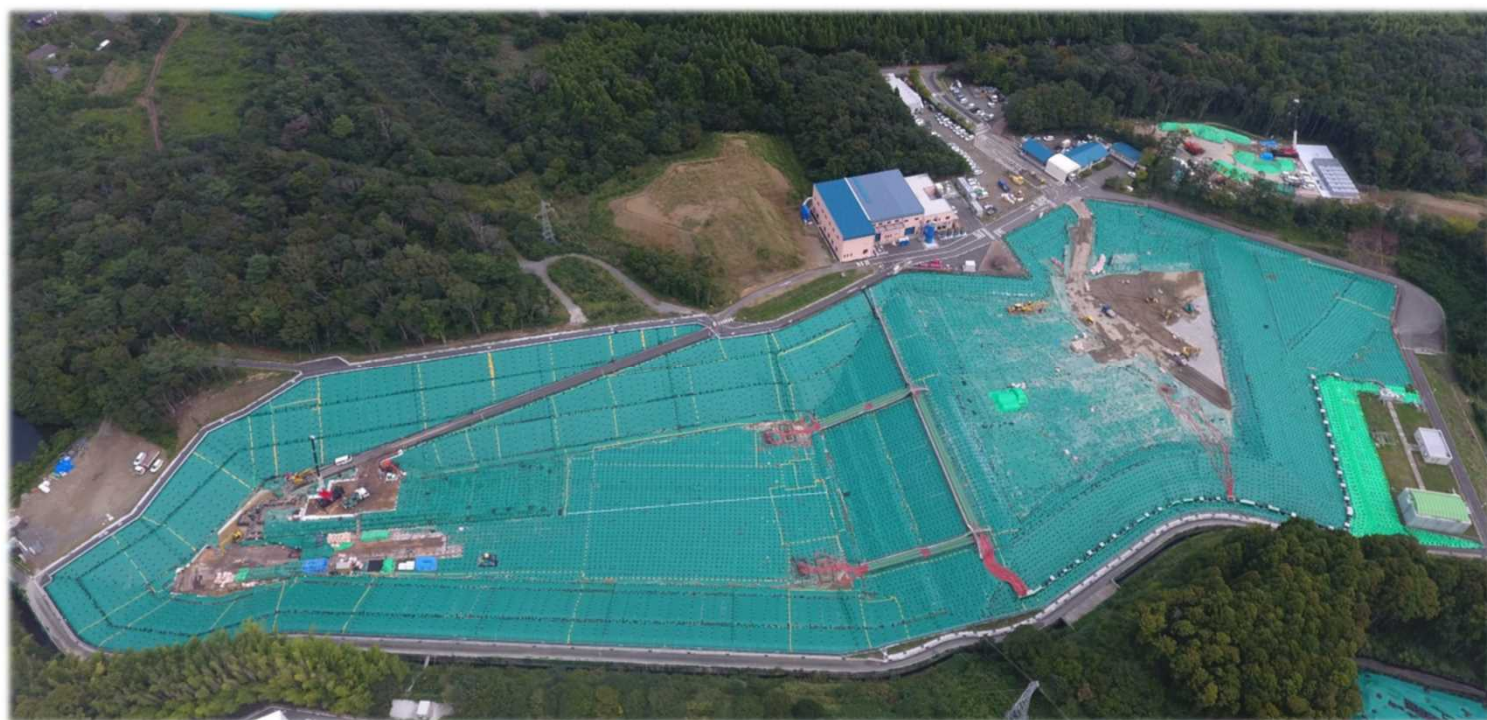
クリーンセンターふたば （2023年9月28日撮影）