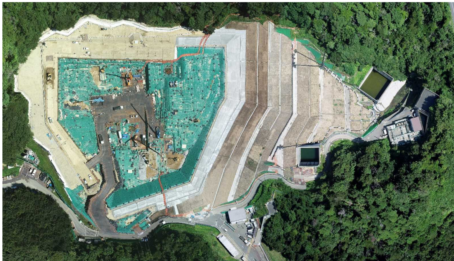
特定廃棄物埋立処分施設（2023年8月21日撮影）