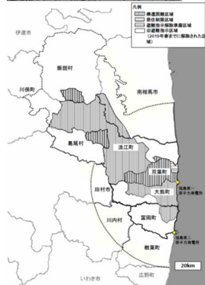
避難指示区域の概念図(2019年4月10日時点)