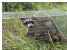
アライグマの捕獲