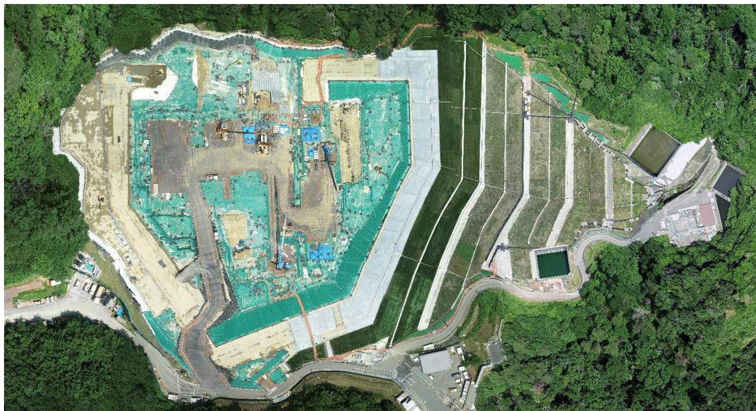
特定廃棄物埋立処分施設（2023年6月19日撮影）