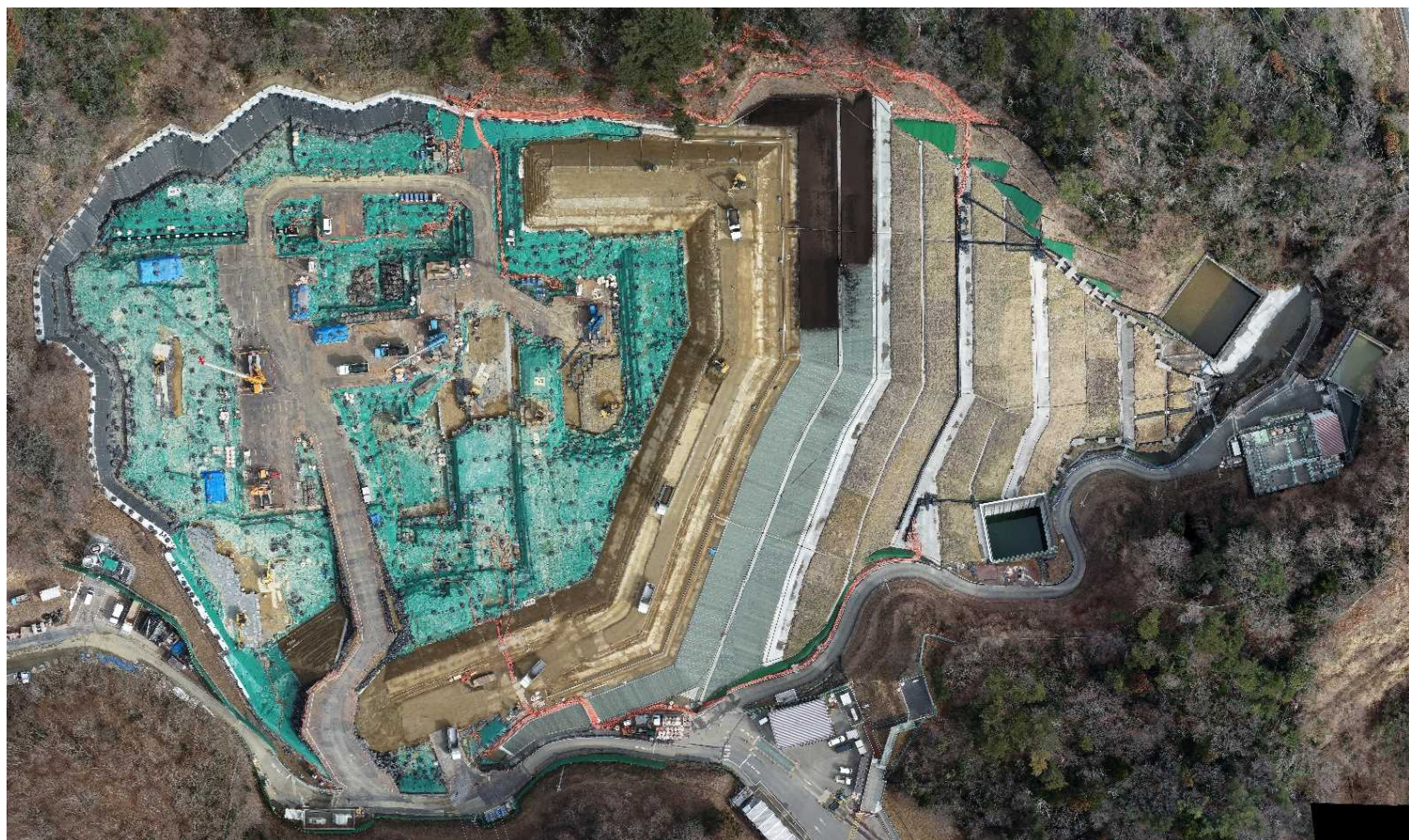
特定廃棄物埋立処分施設（2023年2月15日撮影）