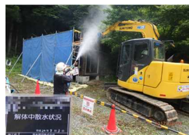
被災家屋等の解体の様子