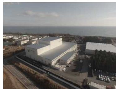
大熊町の仮設焼却施設