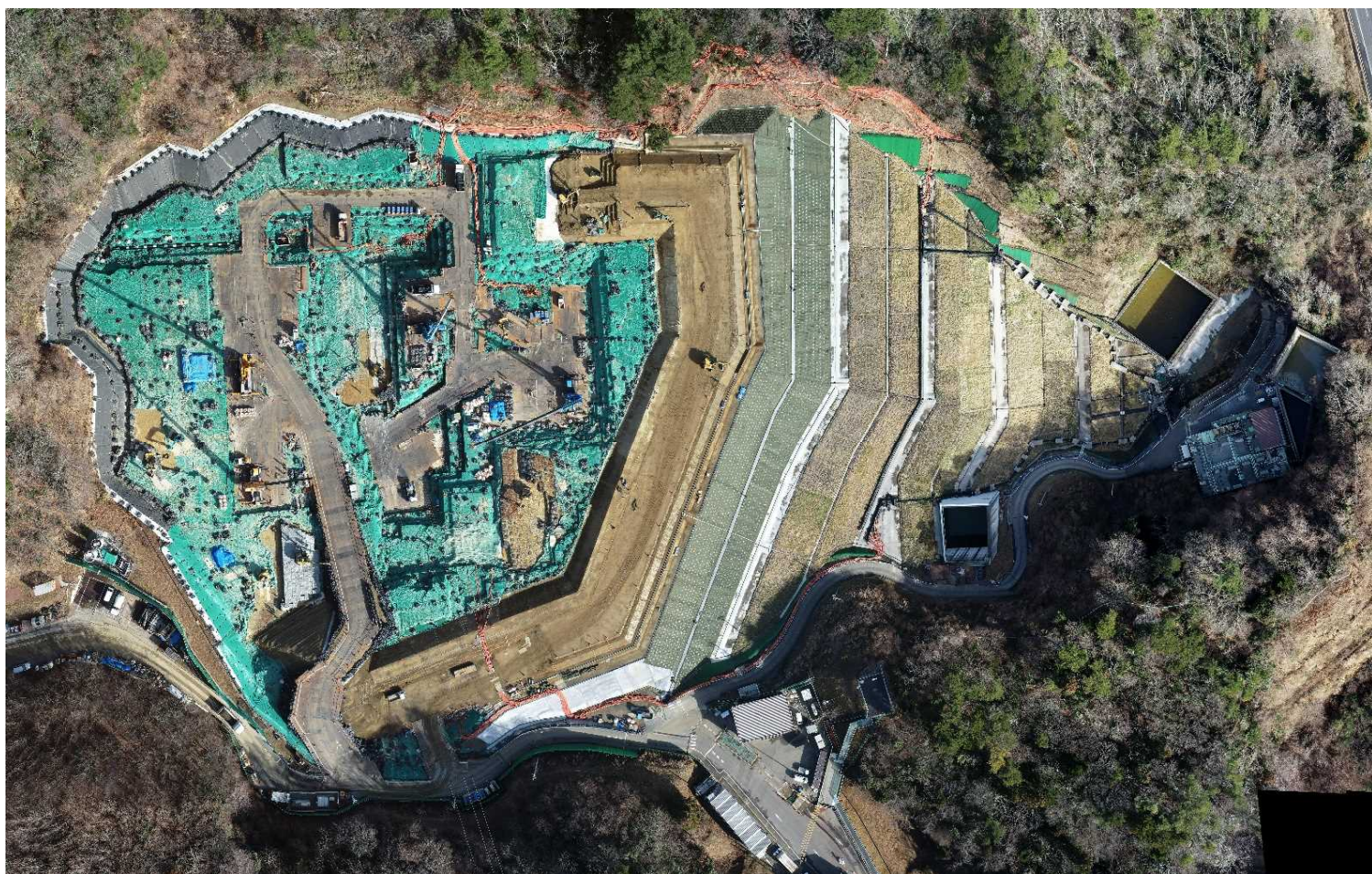
特定廃棄物埋立処分施設（2023年1月17日撮影）