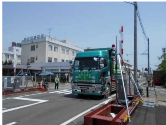
中間貯蔵施設からゲートを通して退域する輸送車両