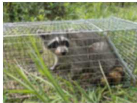
アライグマの捕獲