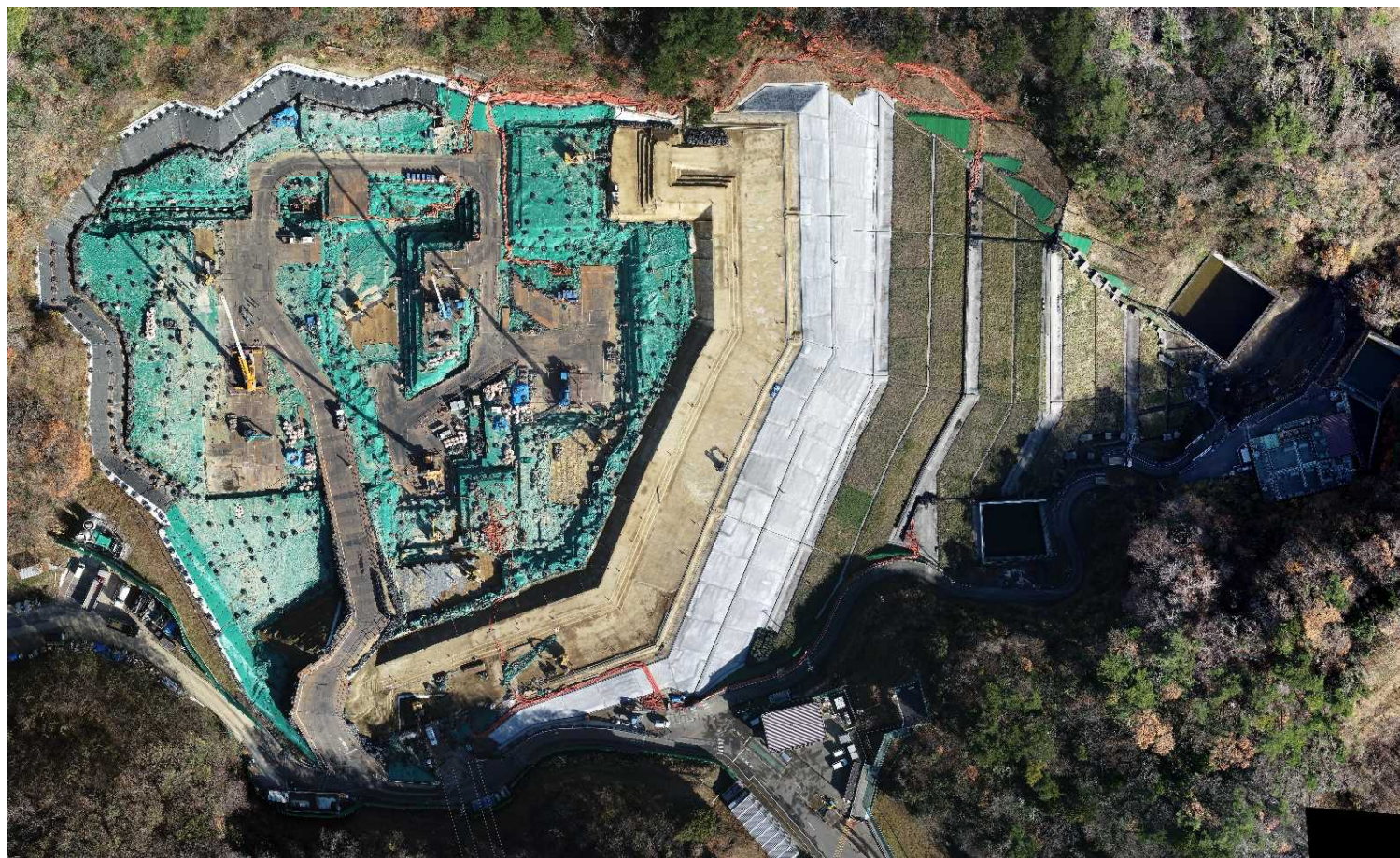
特定廃棄物埋立処分施設（2022年12月16日撮影）