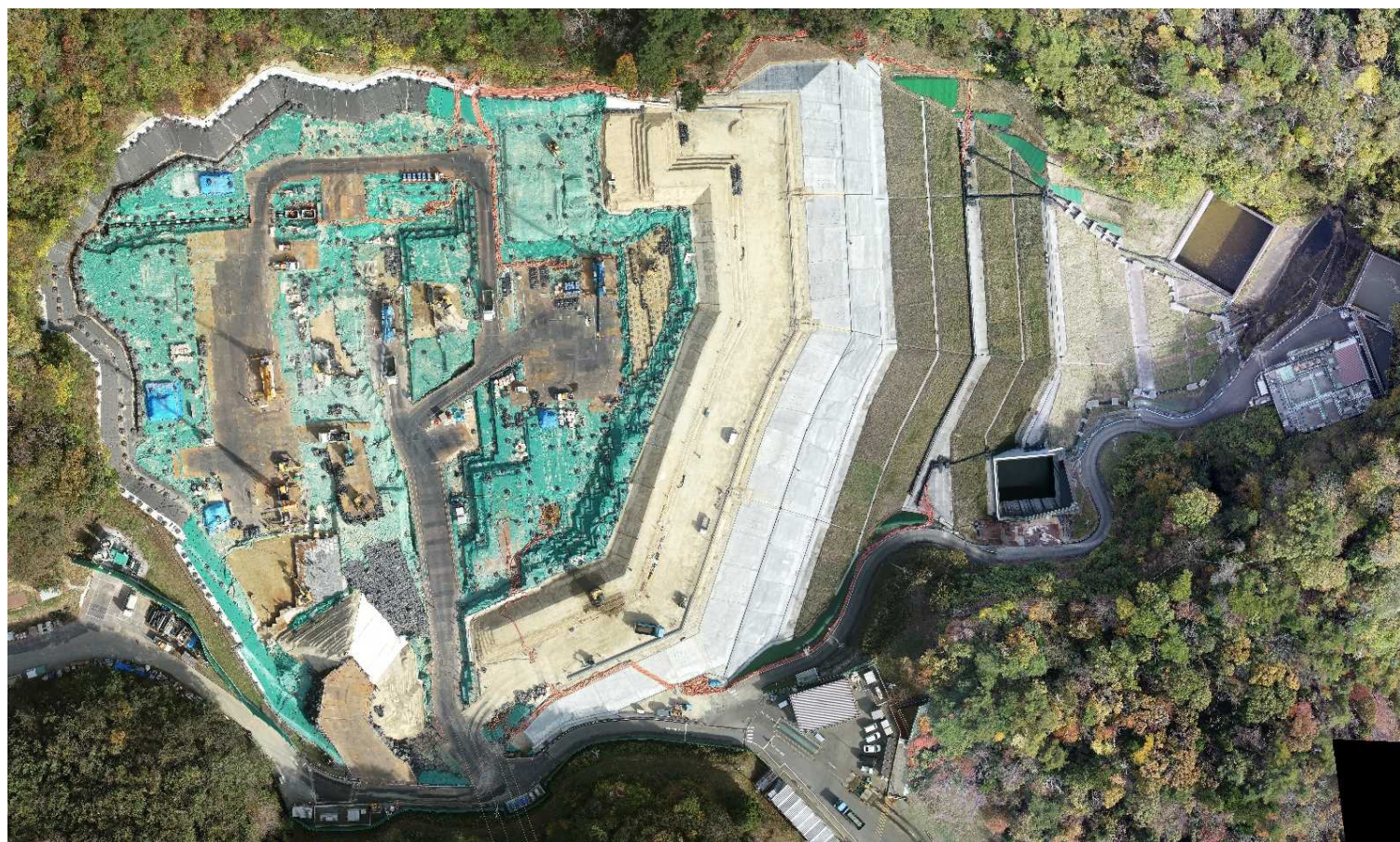
特定廃棄物埋立処分施設（2022年11月14日撮影）