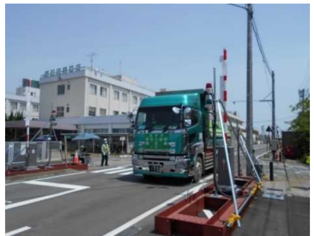
中間貯蔵施設からゲートを通って退域する輸送車両