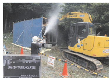
被災家屋等の解体の様子