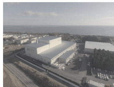
大熊町の仮設焼却施設