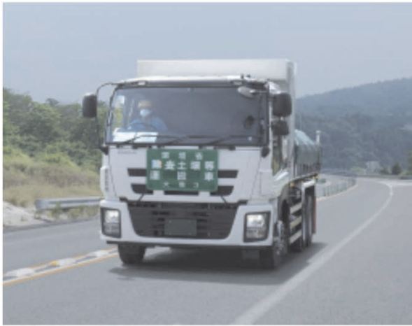
輸送車両の走行状況