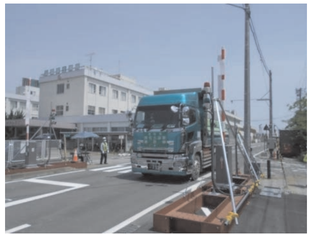
中間貯蔵施設からゲートを通して退域する輸送車両