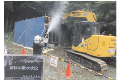
被災家屋等の解体の様子