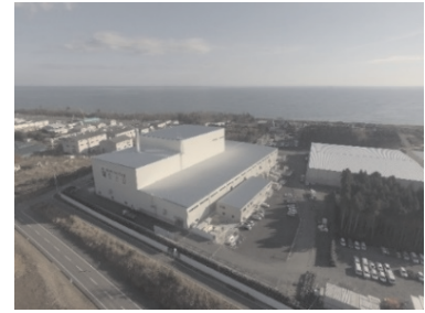
大熊町の仮設焼却施設