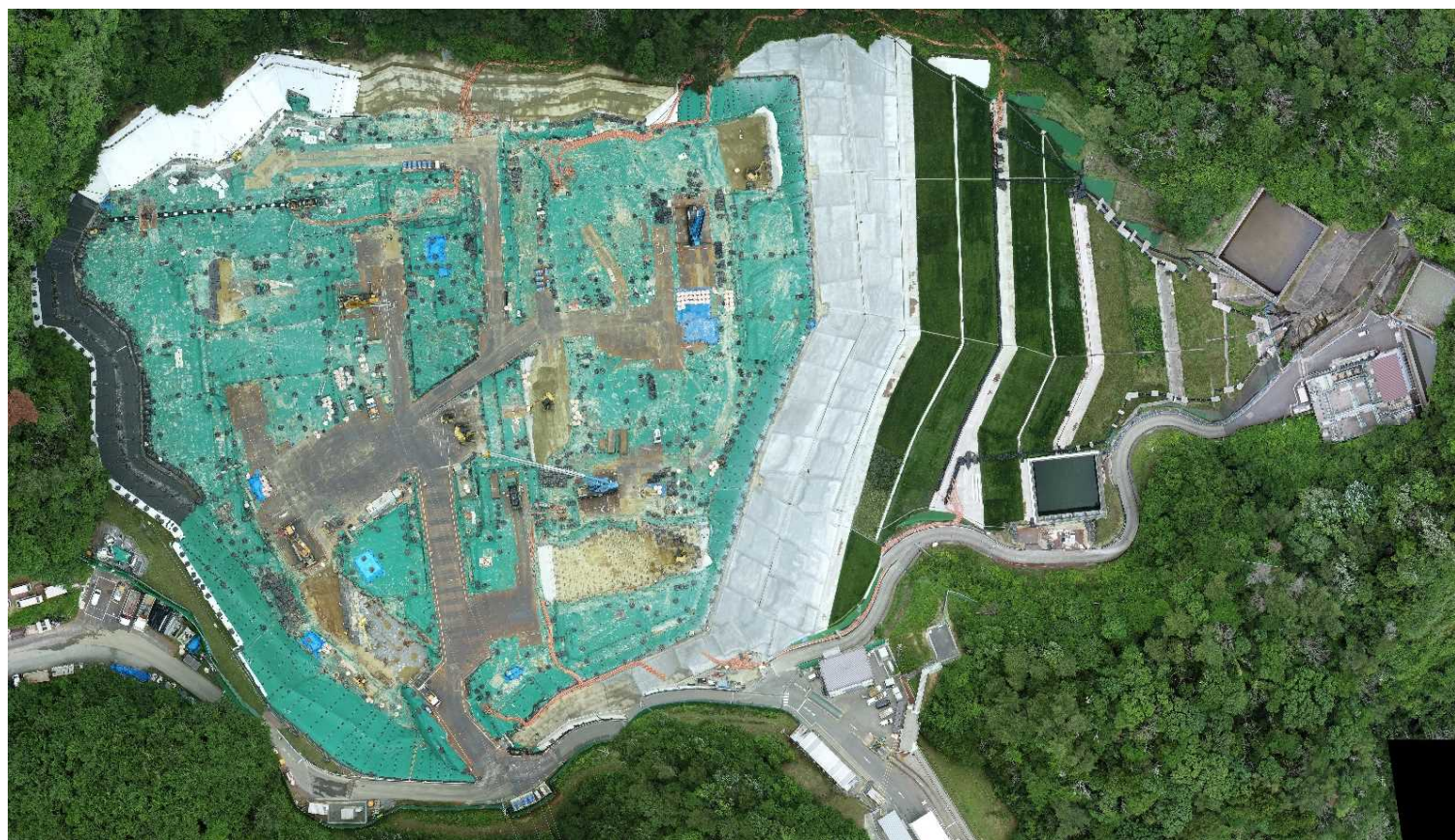
特定廃棄物埋立処分施設（2022年6月14日撮影）