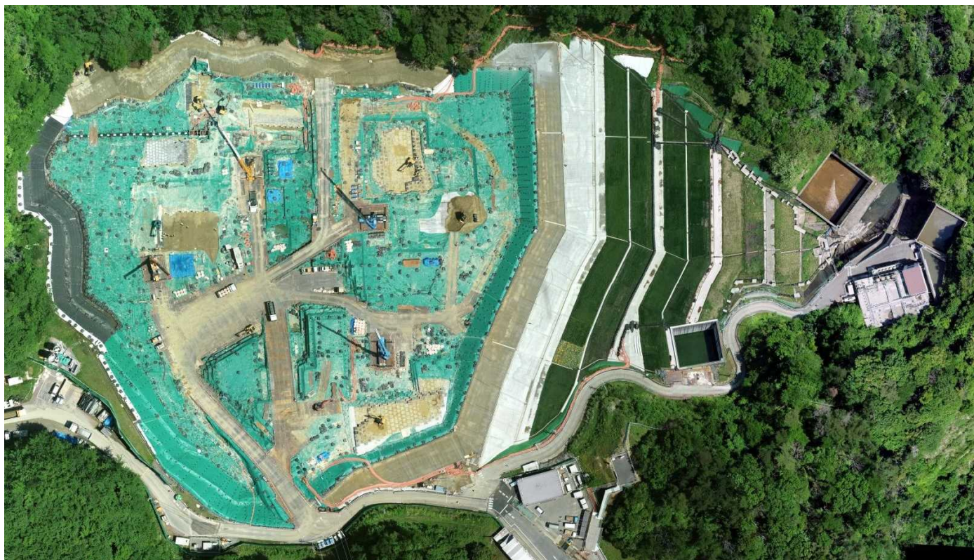
特定廃棄物埋立処分施設（2022年5月18日撮影）