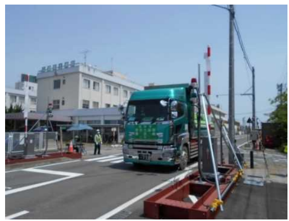
中間貯蔵施設からゲートを通して退域する輸送車両