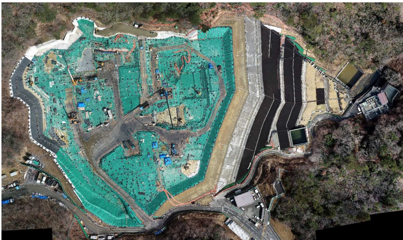
特定廃棄物埋立処分施設（2022年3月15日撮影）