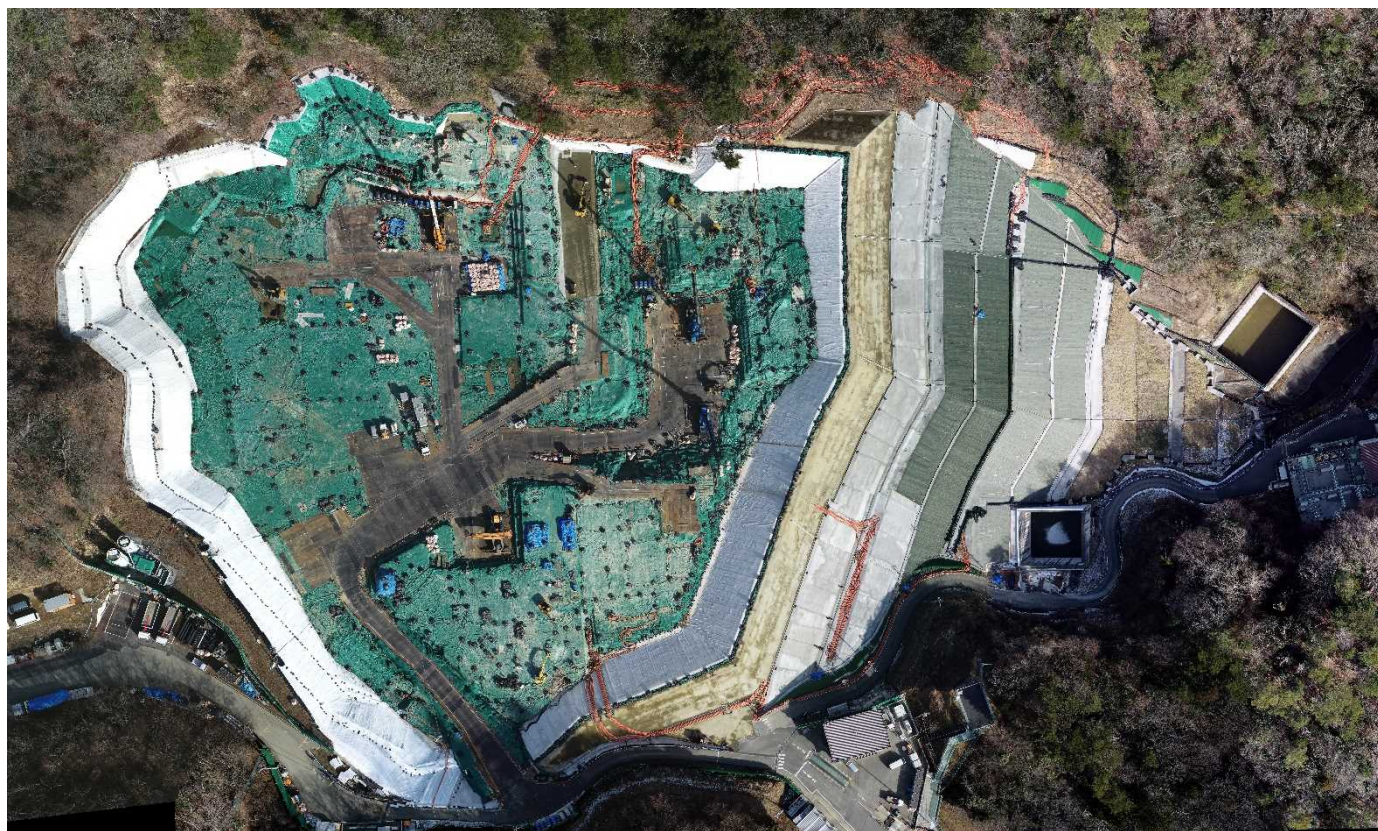
特定廃棄物埋立処分施設（2022年1月15日撮影）