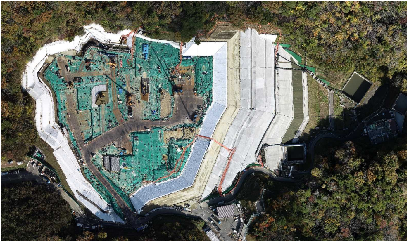
特定廃棄物埋立処分施設（2021年11月15日撮影）