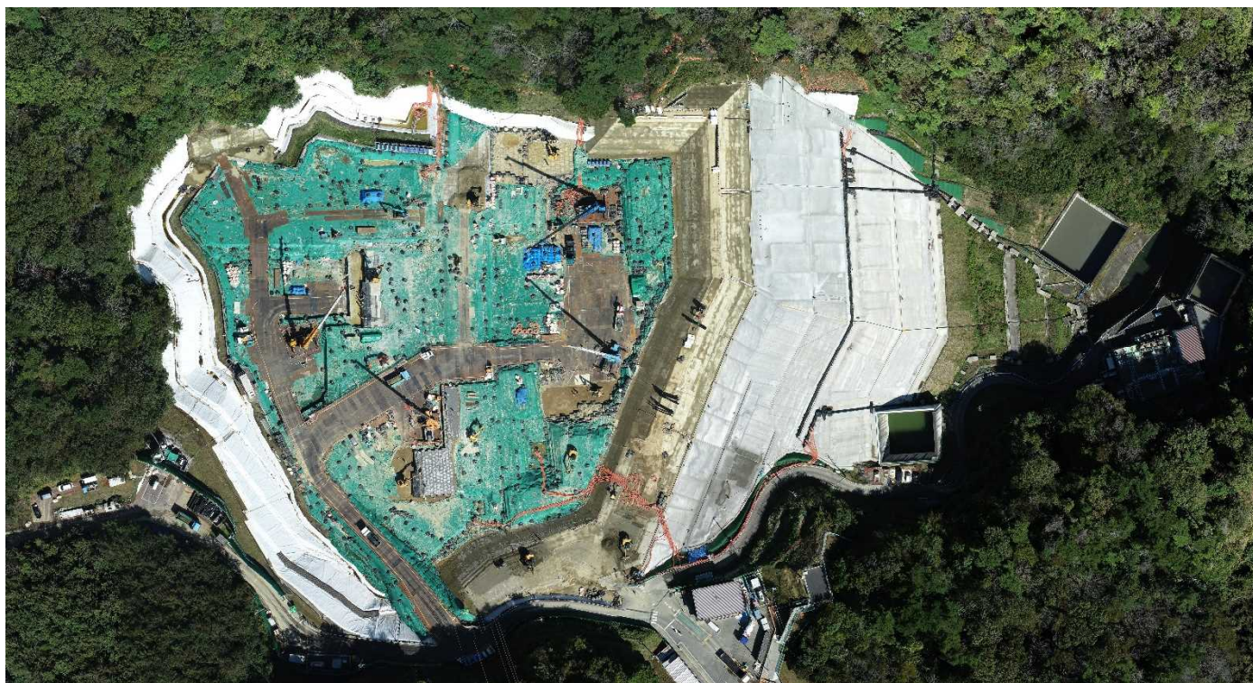
特定廃棄物埋立処分施設（2021年10月15日撮影）