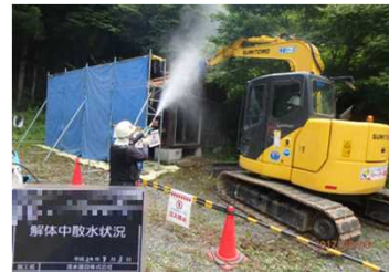
被災家屋等の解体の様子