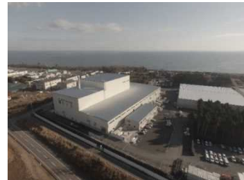
大熊町の仮設焼却施設