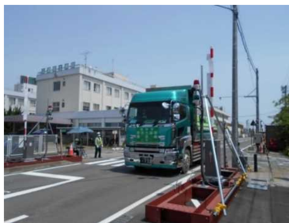
中間貯蔵施設からゲートを通して 退域する輸送車両