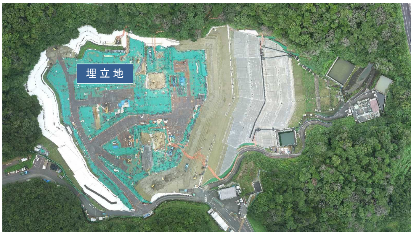
特定廃棄物埋立処分施設（2021年8月16日撮影）