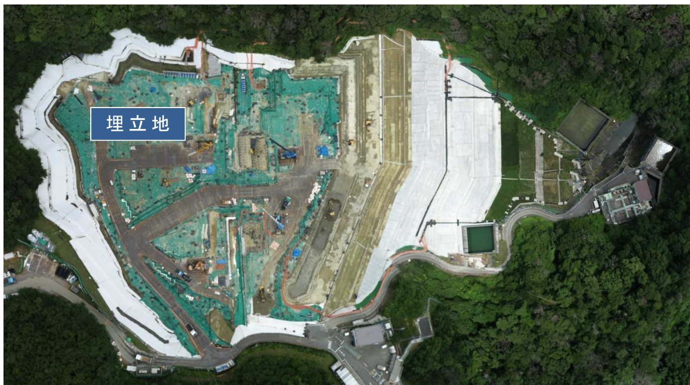
特定廃棄物埋立処分施設（2021年7月15日撮影）