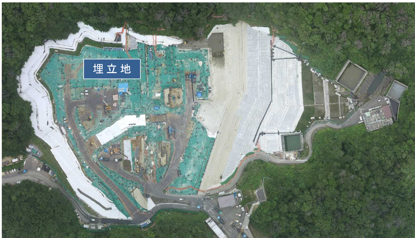
特定廃棄物埋立処分施設（2021年6月15日撮影）