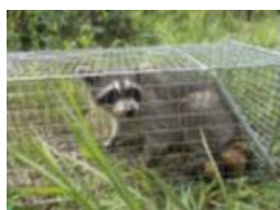
アライグマの捕獲