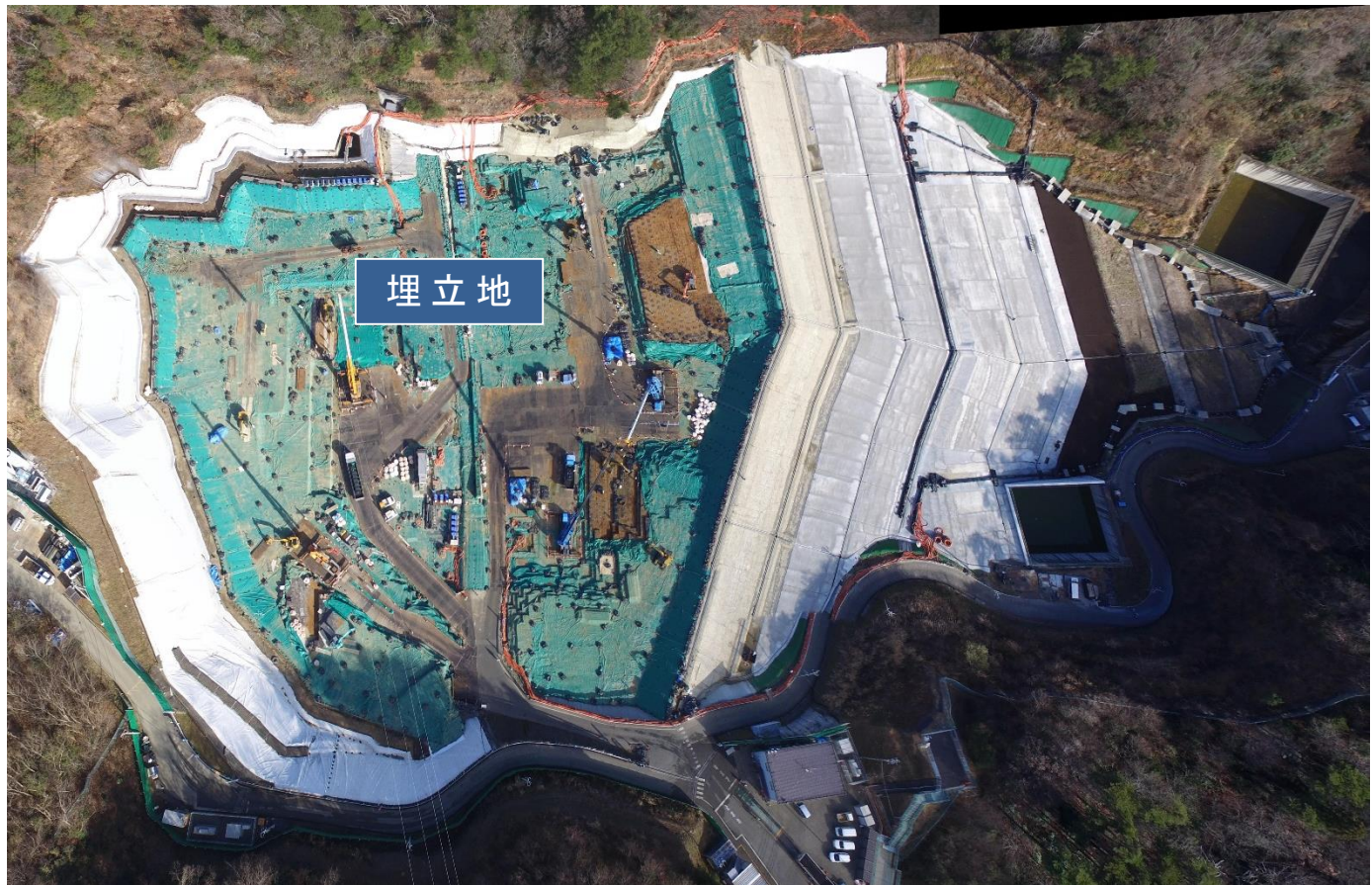
特定廃棄物埋立処分施設 （2020年12月25日撮影）