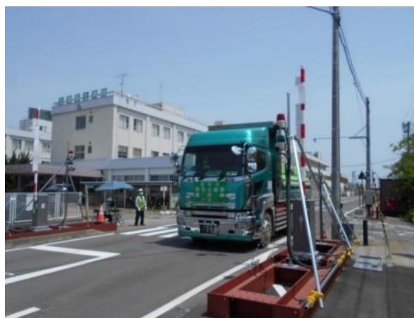
中間貯蔵施設からゲートを通して 退域する輸送車両