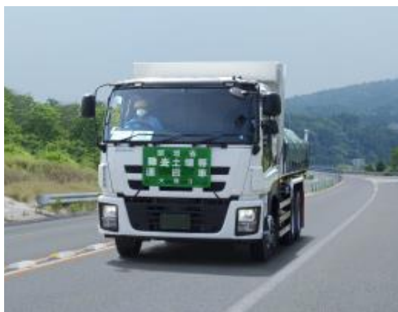
輸送車両の走行状況