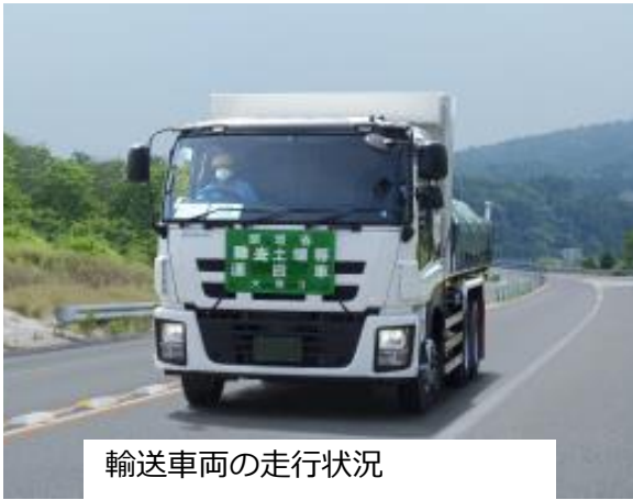
輸送車両の走行状況