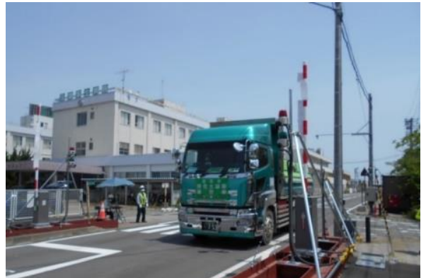
中間貯蔵施設からゲートを通して 退域する輸送車両