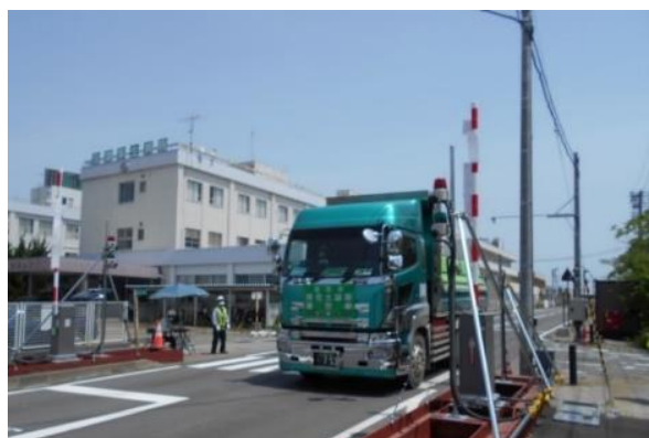
中間貯蔵施設からゲートを通して 退域する輸送車両