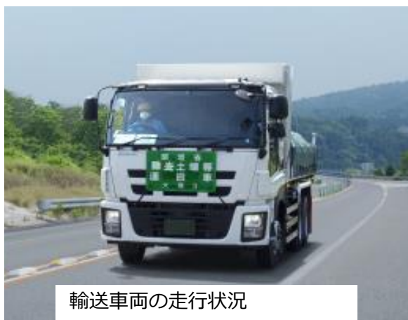
輸送車両の走行状況