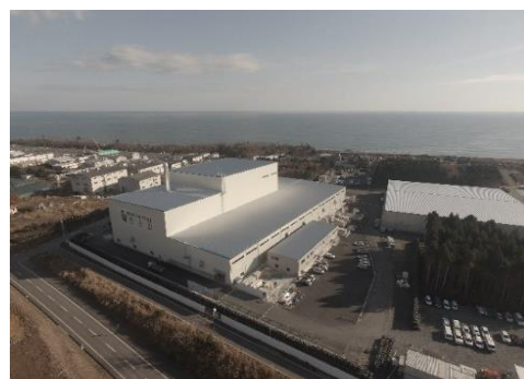
大熊町の仮設焼却施設