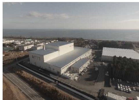
大熊町の仮設焼却施設