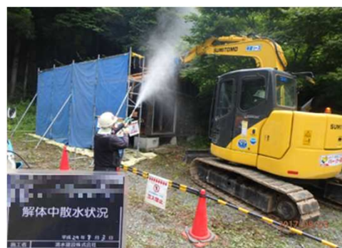
被災家屋等の解体の様子