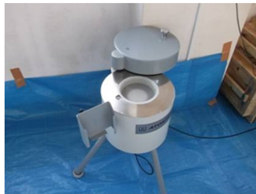
NaI (TI) スペクトロメーター