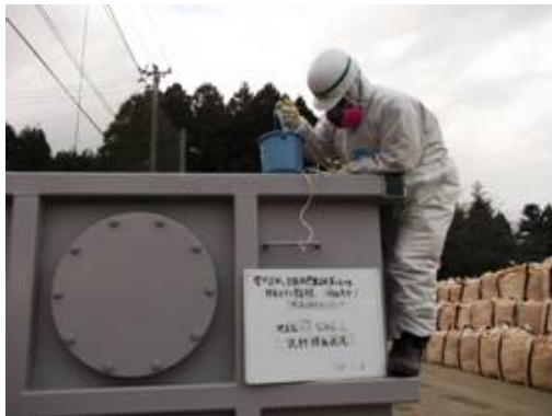
沈殿処理後のサンプリング状況