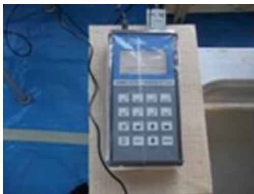
放射能濃度測定結果モニタ