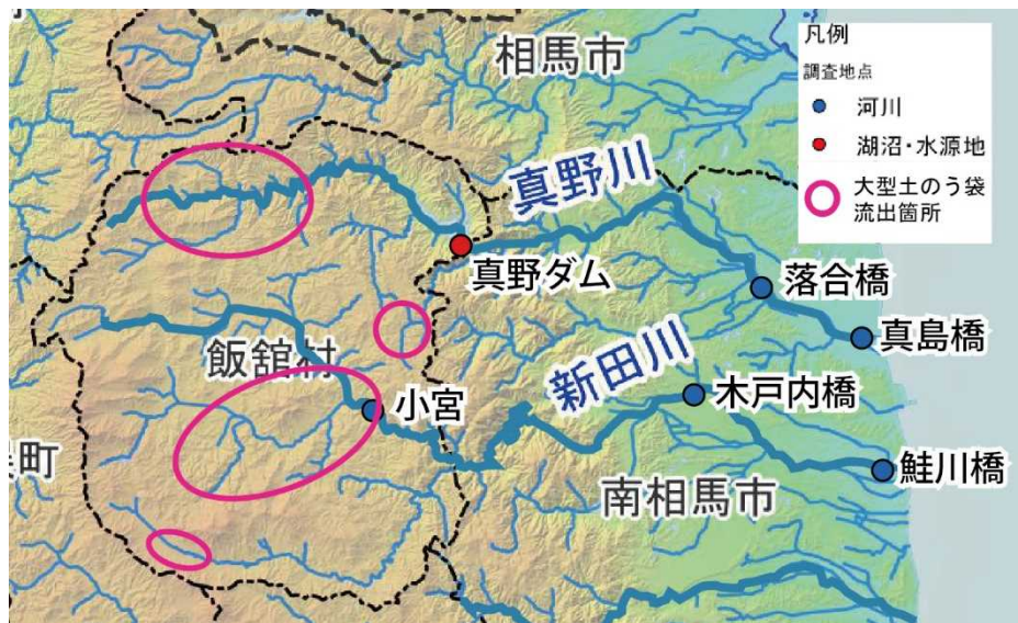
土のう袋の流出箇所とモニタリング地点