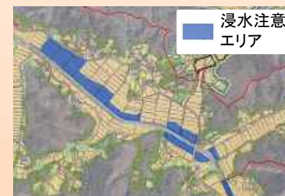
浸水注意エリアの設定