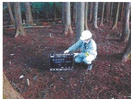
森林除染前後の状況の例(檜葉)