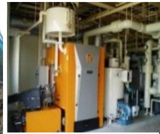
熱供給施設等での利用