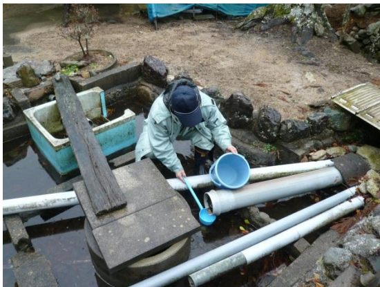
毎月採水の例（広野町）

○2月末までに分析を終えた全検体約700検体のうち、2検体で検出(1.3、1.2Bq/L)され、その他は不検出。