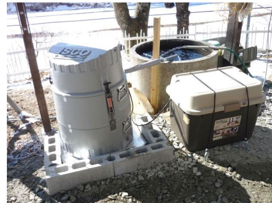
自動採水装置の設置例（川内村）