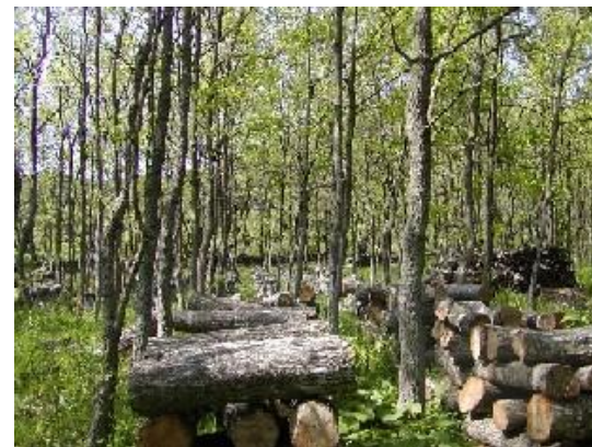
ほだ場のイメージ(左:林野庁HP資料、右:千葉県HP資料)