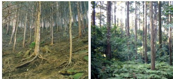
間伐等の適切な森林整備