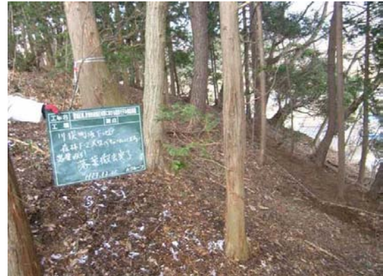
リター層除去が適用困難だった場所の一例 (森林の急斜面)