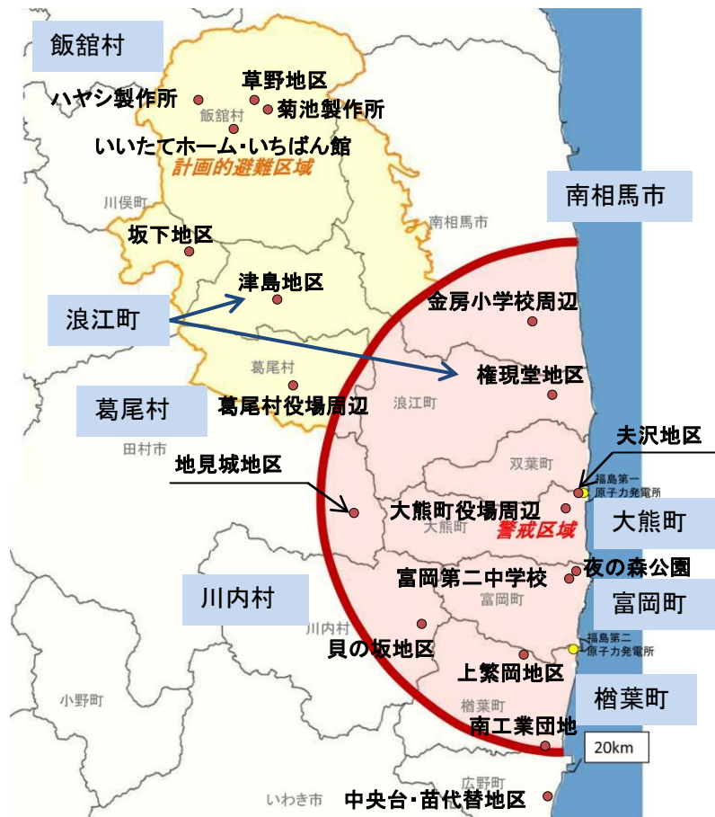
【 除染モデル実証事業対象地区の位置 】