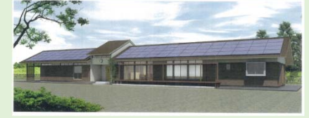
【短期滞在・交流施設イメージ】

<特定復興再生拠点区域に含まれる施設> ・国道399号(帰還困難区域全区間)、県道原町二本松線(県道62号)(帰還困難区域全区間)、村道(曲田線、下曲田線、曲田菅沼線、曲田向線、長泥1号線、長泥2号線、長泥金華山線、寛行線) ・長泥の桜並木など文化資産、共同墓地