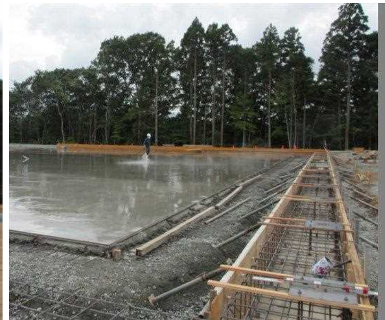
土間基礎・テント基礎 コンクリート打設工事 (8/24)