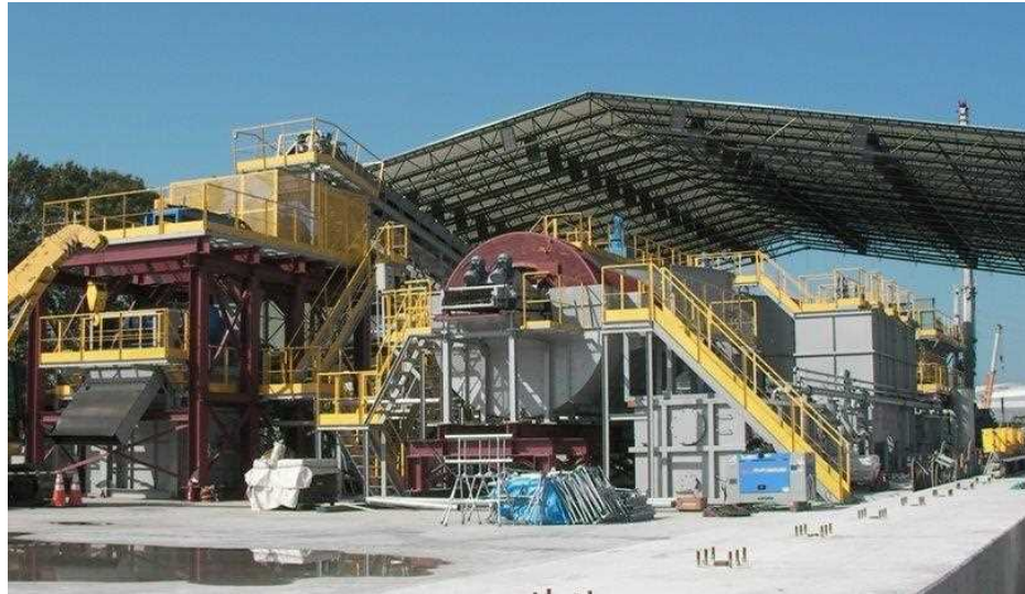
機器設置完了 テント設置、配管工事 (10/26)