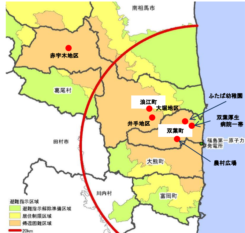
【 帰還困難区域除染モデル実証事業対象地区の位置 】